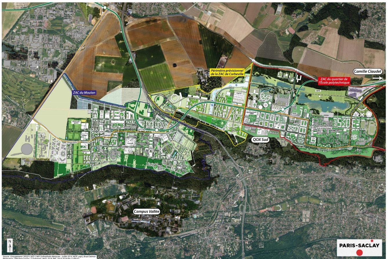
Frange sud du plateau de Saclay aménagée en campus urbain de Paris-Saclay (EPA Paris-Saclay, avril 2019)